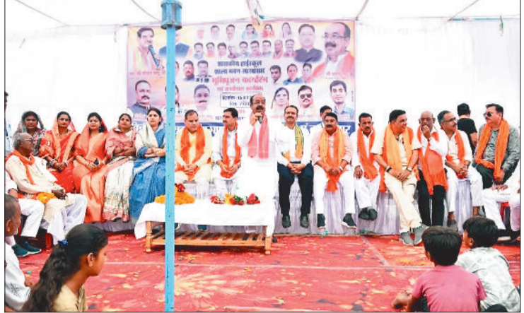
लोगों को संबोधित करते डिप्टी सीएम अरुण साव।

20 लाख के विकास कार्यों की घोषणा भवन व हाईस्कूल का भूमिपूजन- इस दौरान श्री साव ने रहंगी में 7 लाख रुपए की लागत बनने वाले सामुदायिक भवन का भूमिपूजन किया। इसके अलावा ग्राम लाखासार में हाईस्कूल शाला भवन का भूमिपूजन कर कार्य आरंभ किया। यह भवन 75 लाख रुपए से बनकर तैयार होगा। उप मुख्यमंत्री श्री साव ने तीनों गांव में विकास कार्यों के लिए 20 लाख रुपए देने की घोषणा की। इसके अतिरिक्त उन्होंने ग्राम रहंगी में बालवाड़ी निर्माण के लिए 5 लाख रुपए, लाखासार में सीसी रोड निर्माण के लिए 5 लाख रुपए की घोषणा की। साथ ही नवागाम में मुक्तिधाम निर्माण का आश्वासन दिया। वहीं