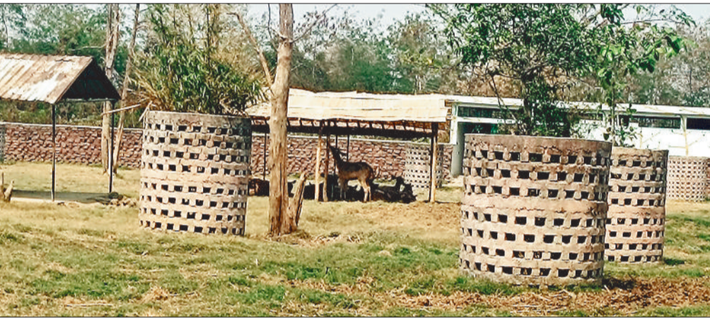
हरिभूमि न्यूज ►► बिलासपुर