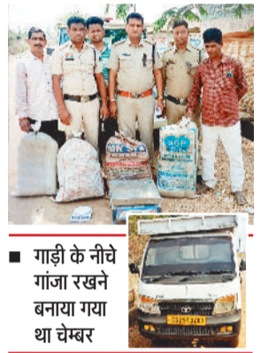
गाड़ी के नीचे गांजा रखने बनाया गया था चेम्बर