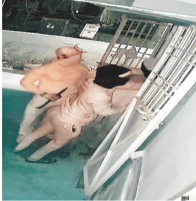
मकान का दरवाजा तोड़ते नकाबपोश।