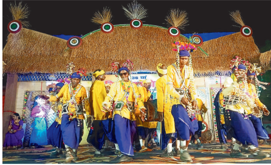
हरिभूमि न्यूज || बिलासपुर

लोक संस्कृति का अनूठा दर्शन मिलता है, बिलासा महोत्सव में, हजारों दर्शकों के साथ 36 वें रंगारंग समापन हुआ। इस मंच की खूबसूरती है कि अनजाने से कलाकारों और बड़े कलाकारों को मंच में प्रस्तुति का अवसर मिलता रहा है। अंचल के कला और कलाकारों के लिए यह मंच समर्पित रहा है।